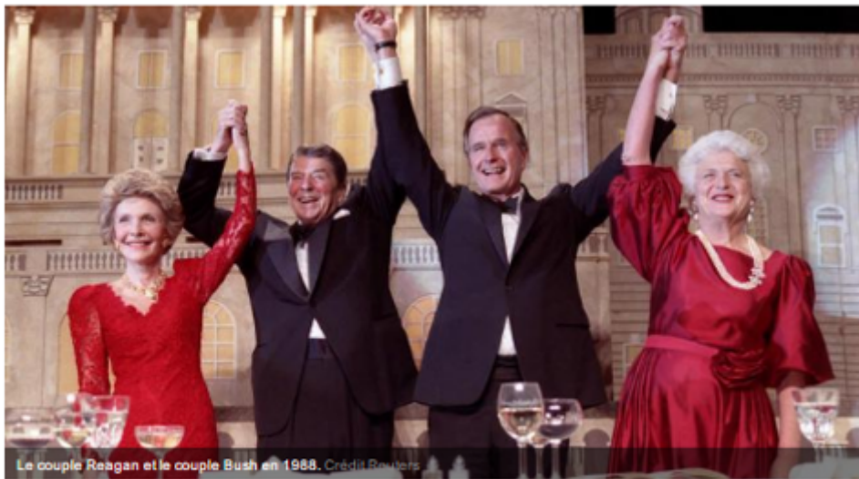
Le couple Reagan et le couple Bush en 1988.

De hecho, los nombres pueden cambiar de un idioma a otro. Podríamos multiplicar ejemplos: ¿Por qué los italianos llaman al rey de Francia Luigi XIV, pero los españoles dicen que él es Luis XIV? ¿Por qué ellos no dicen Louis XIV, como lo hacen los franceses? ¿En inglés por qué dicen Christopher Columbus; en español Cristóbal Colón? ¿Por qué no lo dicen en la forma correcta, italiana , Cristoforo Colombo? ¿Por qué decimos que el zar ruso se llamaba Iván, cuando todo el mundo sabe que la forma correcta del nombre es Иван? ¿Por qué trabajo junto a misioneros a quienes sus padres llamaron Paul, Mark, y Andrew, pero en el país centroamericano donde nosotros trabajamos ellos responden a Pablo, Marcos y Andrés? ¿Por qué mi apellido es escrito y pronunciado diferente en inglés que en el original en sueco (Sjögren)? ¿Porque eso es lo que sucede con los nombres! Si alguien le dice que la pronunciación o la ortografía de los nombres no puede cambiar entre idiomas, entonces ellos necesitan salir de la casa y viajar más, o quizás aprender otra lengua.